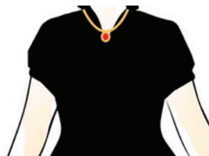
Kleine Kragen & klassische Blusen